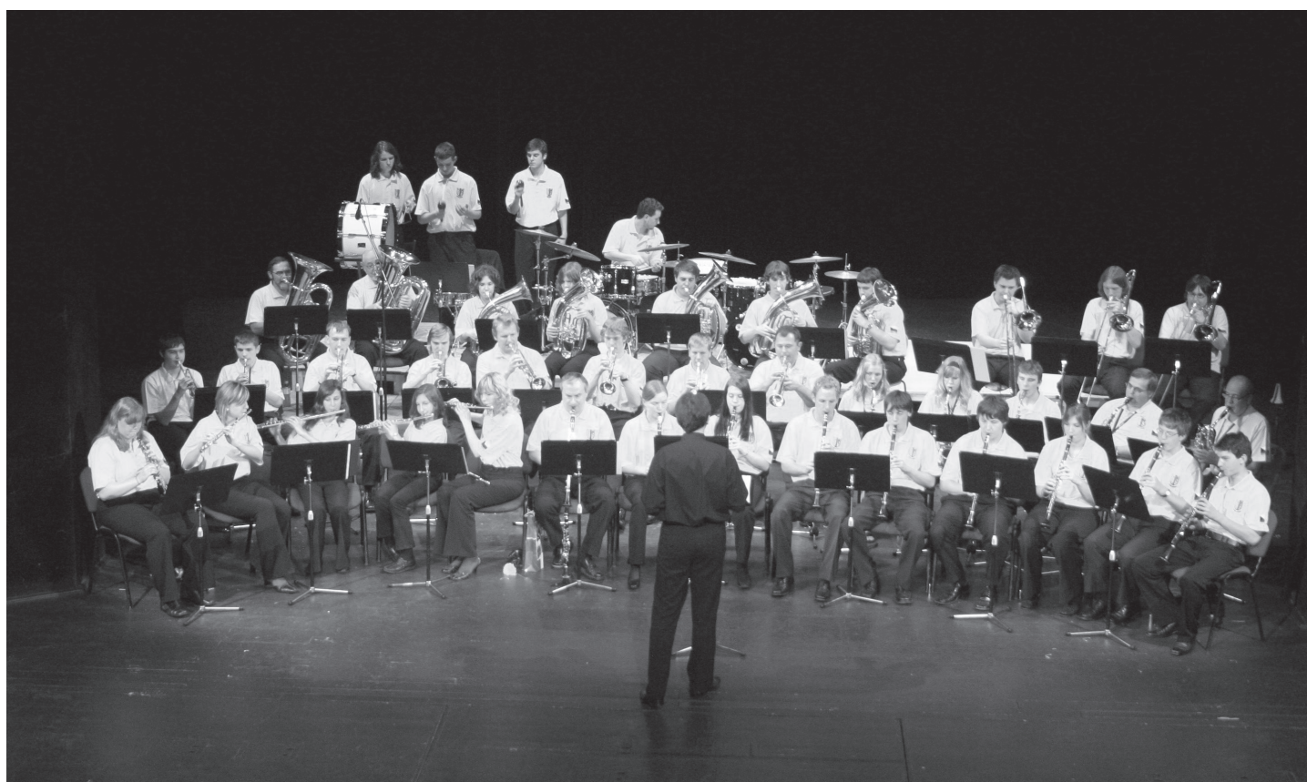
Dechový orchestr ZUŠ Opava